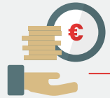
schuldeiser, aandeelhouders, de OR of de PV