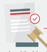
de rechtbank keurt akkoord goed

In deze fase dient de ondernemer ook aan de rechtbank toestemming te vragen voor het opzeggen van overeenkomsten.